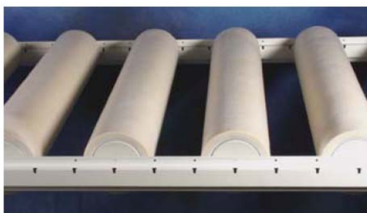
SONO ® R in Trageprofil