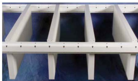
SONO ® B in Trageprofil